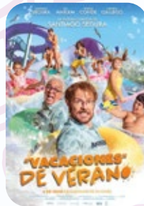
19 AGOSTO Vacaciones de Verano