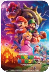
31 JULIO Super Mario Bros