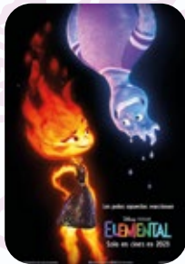
6 AGOSTO Elemental