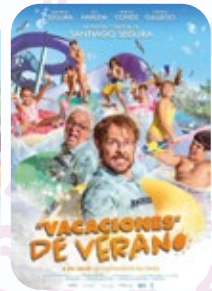
20 AGOSTO Vacaciones de Verano