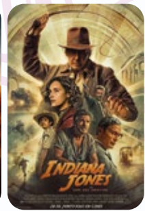
4 AGOSTO Indinana Jones y El Dial del Destino