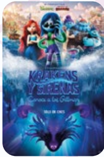
1 AGOSTO Kraquens y Sirenas