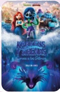
2 AGOSTO Kraquens y Sirenas