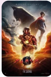
3 AGOSTO The Flash