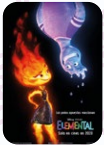
5 AGOSTO Elemental