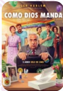
18 AGOSTO Como Dios Manda