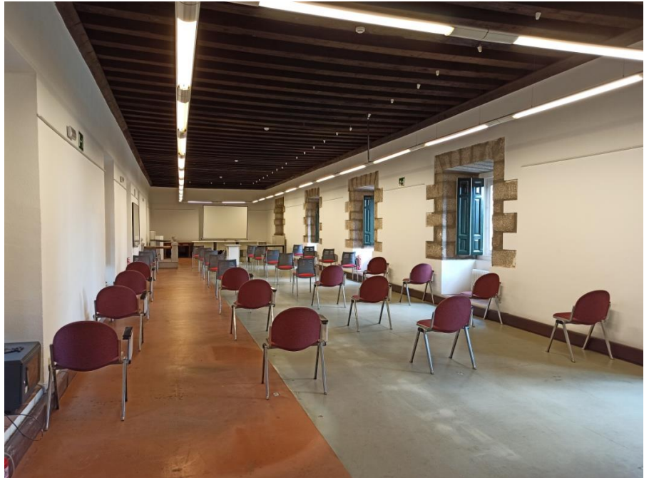
Sala "Manuel Andújar"