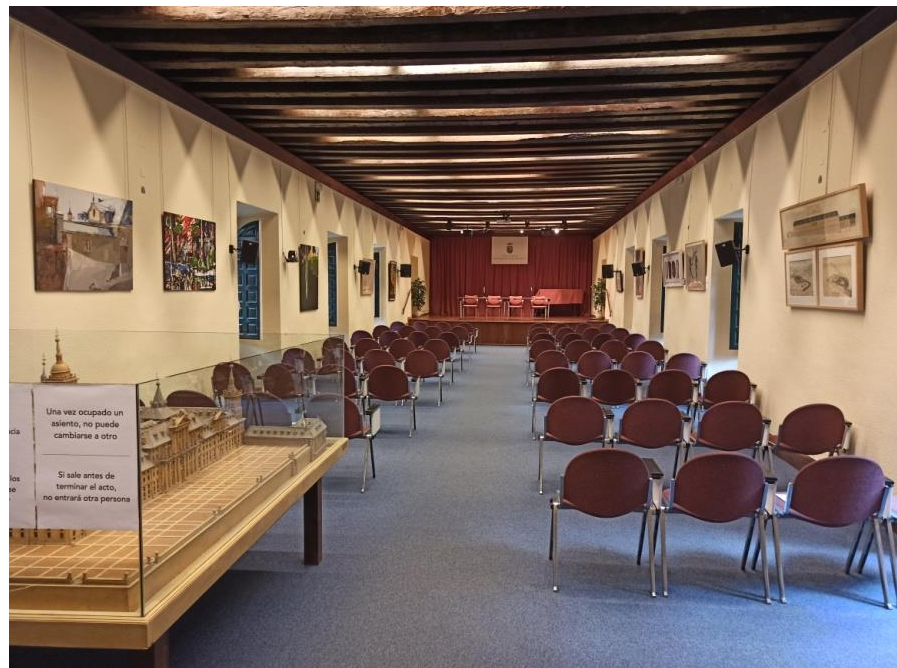
Salón de actos