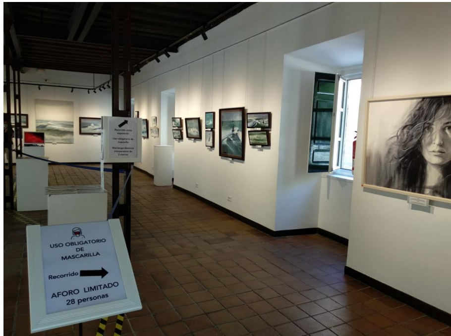
Sala exterior de exposiciones

NOMBRE: Javier Montenegro Peña José Enrique París Barcala Firmado Digitalmente en el Ayuntamiento de San Lorenzo de El Escorial - https://sede.aytosanlorenzo.es - Código Seguro de Verificación: 28294IDOC264E7596FB1D14B45B2