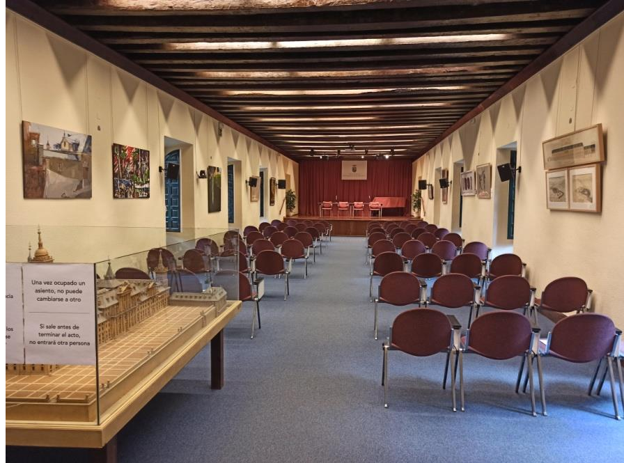
Salón de actos

FECHA DE FIRMA: 21/10/2020 22/10/2020 HASH DEL CERTIFICADO: A3915CC8930722BADFE1FB9653AECC7DBB7BE586 91B67FC5D776B4E99185FA768353827C8E0E3E54 Código Seguro de Verificación: 28294IDOC264E7596FB1D14B45B2